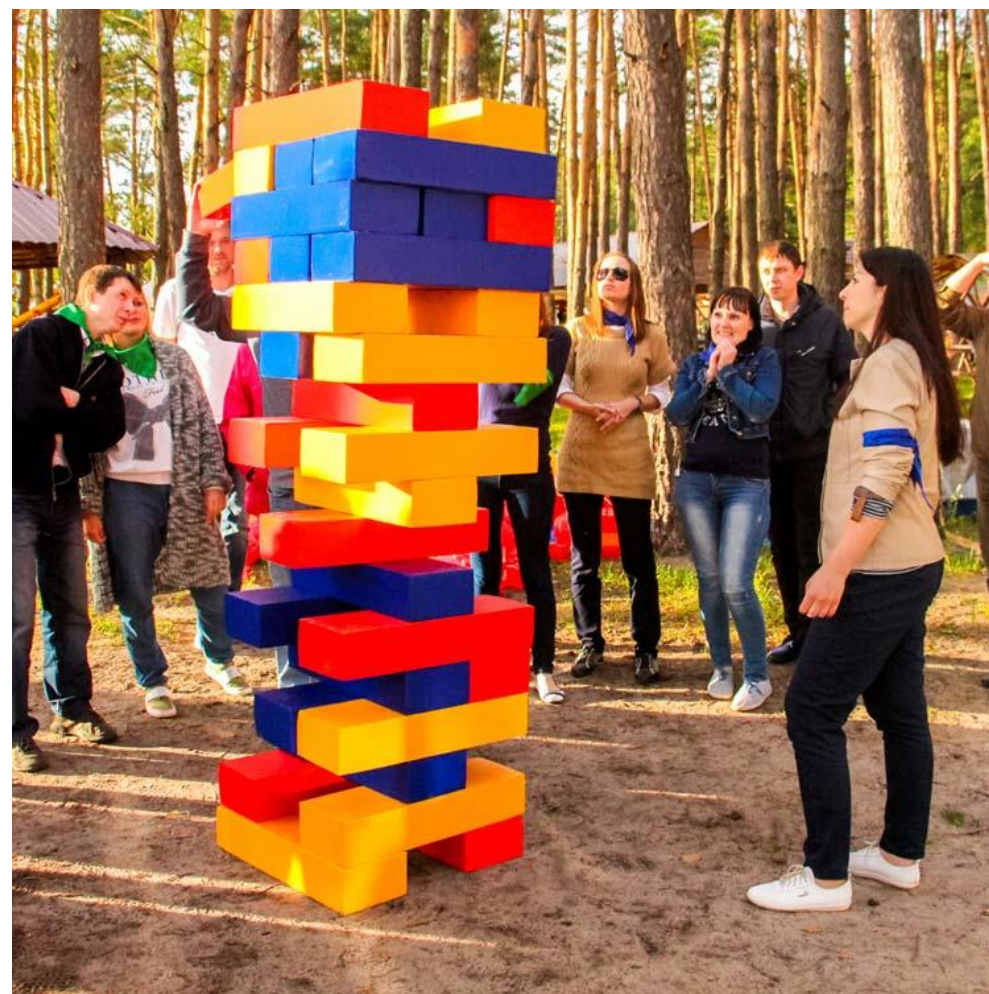
Игра в большую дженгу